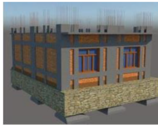
स्प्लिण्ट र ब्याण्डेज

(Splint and Bandage), ज्याकेटिङ (Jacketing) तथा पिलर ज्याकेटिङ (Pillar Jacketing) विधिहरू मार्फत भूकम्प प्रतिरोधी बनाईन्छ ।