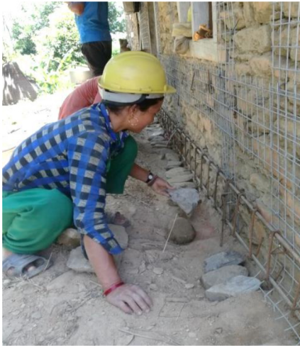
गोरखा भूकम्पमा आंशिक क्षति भएपछि प्रबलीकरण गरिएको दोलखाको एक घर ।

मार्फत बलियो र भुईँचालो थेग्ने बनाउन सकिन्छ । पुराना घरहरूको प्रबलीकरण गर्नुका धेरै फाइदाहरू छन् । यसले भूकम्पका बेला कमजोर घर-संरचनाहरू भत्किएर हुन सक्ने जनधनको क्षतिलाई कम गर्छ । यसबाट पुराना एवं ऐतिहासिक, निजी तथा सार्वजनिक भवन, दरबार, टावर, धार्मिक तथा साँस्कृतिक संरचनाको संरक्षण हुन्छ । परंपरागत तथा मौलिक निर्माण पद्धतिको संरक्षण हुन्छ । सुरक्षित समुदाय निर्माणमा योगदान पुग्छ । प्रबलीकरणका लागि नयाँ दक्ष प्राविधिक जनशक्तिको विकास हुन्छ । स्थानीय निर्माणकर्मीहरूलाई रोजगारीको अवसर सृजना हुन्छ । वातावरण अनुकूलित भएकाले प्रबलीकरणबाट स्थानीय निर्माण सामग्रीको खपत हुन्छ । खासगरी पुराना भवन-संरचनाहरू रैथाने निर्माण पद्धतिमा आधारित हुने भएकाले त्यस्तो निर्माण पद्धतिको संरक्षण हुन्छ । नयाँ घर बनाउँदा लाग्ने अनावश्यक खर्च जोगिन्छ । प्रबलीकरण पद्धति मार्फत नगरपालिकालाई भूकम्प प्रतिरोधी नमुना नगरको रूपमा विकास गर्न सकिन्छ ।